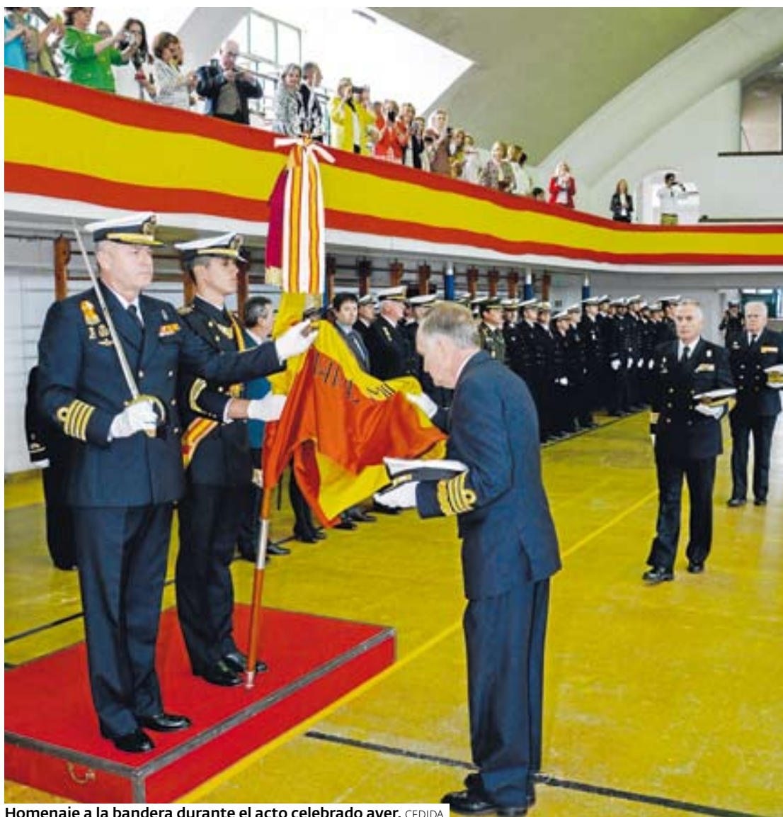
Homenaje a la bandera durante el acto celebrado ayer.

SUPLEMENTO SEMANAL DE DIARIO DE PONTEVEDRA ÍNDICE | 2 MARÍN | 6 BUEU | 6 CANGAS | 6 MOAÑA | 7 DEPORTES