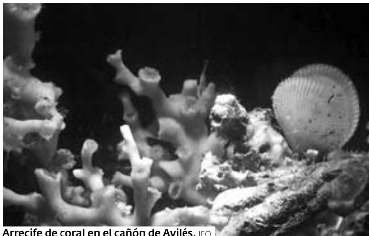
Arrecife de coral en el cañón de Avilés.

Investigadores del Instituto Español de Oceanografía (IEO), embarcados en el buque oceanográfico Vizconde de Eza, han descubierto un arrecife de coral de aguas frías en una zona profunda del cañón de Avilés. Hasta ahora se desconocía la existencia de este tipo de arrecifes en aguas españolas.