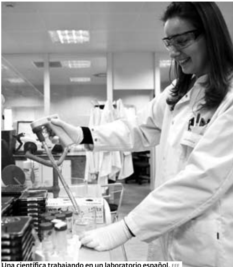
Una científica trabajando en un laboratorio español.

Asimismo, el trabajo destaca como principal novedad el estudio sobre los aspectos en los que se producen las principales diferencias entre las condiciones laborales en el exterior y en España.