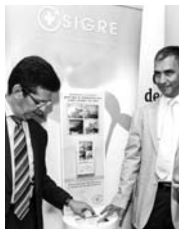
Punto de recogida de fármacos.

Reutilizar medicinas sobrantes de otras personas puede producir más daños que beneficios al paciente, al ser una posible vía de contagio de un usuario a otro de enfermedades distintas a las que ya tenían, por lo que conviene deshacerse de los restos de fármacos por cauces adecuados.