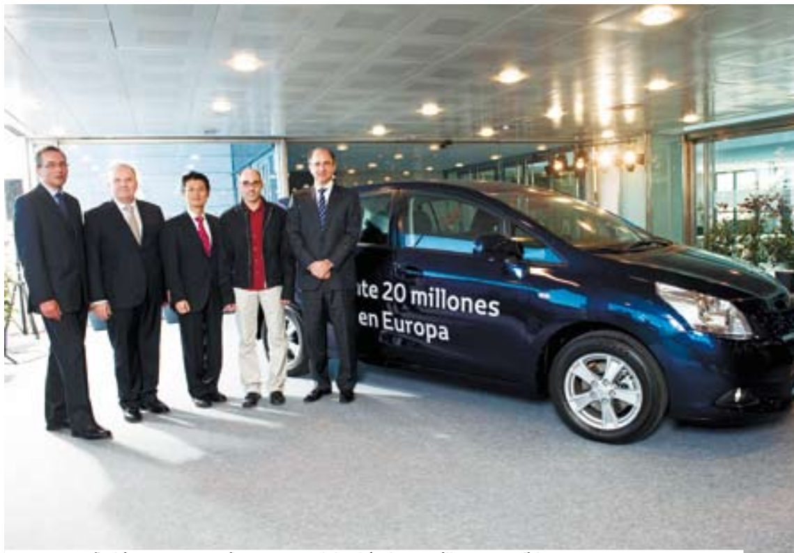
Toyota España hizo entrega recientemente del vehículo 20 millones vendido en Europa, un Verso 2010.

Además, arremetió contra la política de algunas marcas de automotricular vehículos, pues considera que esta práctica supone un