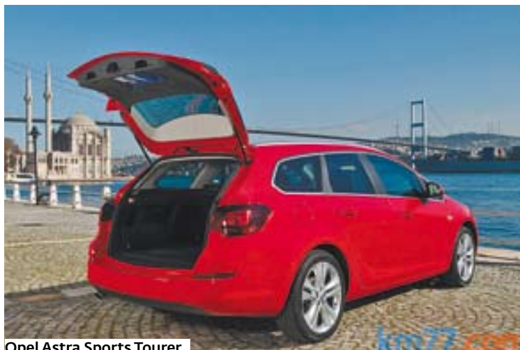
Opel Astra Sports Tourer.

sulta muy luminoso, creando a los ocupantes una notable sensación de espacio.