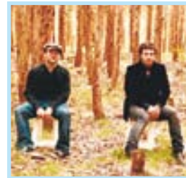
LA IGUANA CLUB El hombre del tiempo VIGO POP

✓The Queers es una banda de pop punk de New Hampshire, EE UU formada en 1982. The Queers tocan un estilo pop punk muy influenciado por The Ramones y The Beach Boys, con canciones sobre chicas y cerveza. Este año han publicado un nuevo trabajo discográfico que lleva por título 'TBA'. Sus conciertos son una verdadera descarga de fuerza y energía. Los asistentes a su concierto de hoy en la mítica sala 'La Iguana Club' no saldrá defraudado. La actuación comenzará sobre la medianoche.