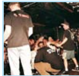
LA IGUANA CLUB The Queers VIGO POP-PUNK

✓El rapero catalán llega a Vigo para presentar su último disco, 'Contradicciones'. Se trata de un gran trabajo con la esencia y la personalidad única de ZPU, con su fuerza y su forma tan especial de transmitir sentimientos. Es un álbum donde el mc de la ciudad condal da otro paso adelante en sus contenidos, en su forma de escupir los raps, en la profundidad que adquiere cada canción. Sus fans podrán disfrutar de su actuación en directo hoy, en la Sala Mondo, a partir de las 22.00 horas.