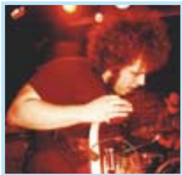
SALA KARMA The Joe k-plant PONTEVEDRA HARD-CORE

Si su primer álbum impacta desde la primera escucha, su verdadero poder está en el directo. "Que el público disfrute es lo que pretendemos".