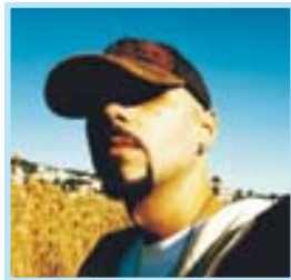
SALA MONDO ZPU VIGO RAP

✓Cla es uno de los grupos más importantes del panorama musical portugués. Después del debut en los EE UU, en el Festival South by Southwest (Austin, Texas), y en Budapest (Hungría), el grupo presentó su último trabajo discográfico, 'Cintura' en la Sala Tabóo, en Madrid, y las reacciones del público fueron muy positivas, de tal forma que EMI Music decidió distribuir el disco en España. Pontevedra es una de las paradas en la gira española de presentación de 'Cintura'. Mañana, a partir de las 23.00 horas. Entrada a 6 euros.