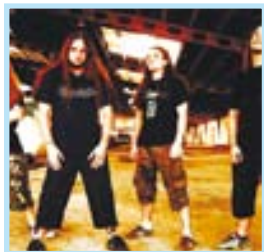
LA IGUANA CLUB Angelus Apatrida VIGO HEAVY METAL

Ya no hay localidades disponibles para disfrutar del concierto que la banda catalana Love of Lesbian dará el 19 de diciembre en el Pazo da Cultura de Pontevedra. Esta cita musical, que empezará a las 21 horas, funcionará como concierto de cierre de la gira del conjunto liderado por Santi Balmes, que lo ha traído en numerosas ocasiones a Galicia. Los privilegiados que dispongan de entrada disfrutarán de un concierto en directo en el que escucharán los temas de su último disco, '1999', un auténtico éxito en el panorama del pop-rock indie nacional.