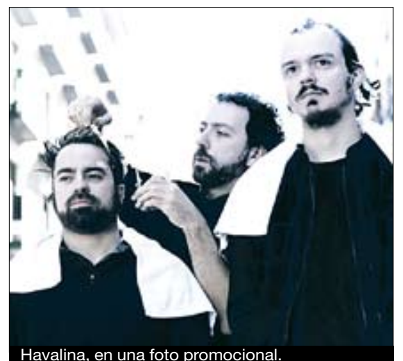
Havalina, en una foto promocional.

Entre sus referencias hay post-punk , en la línea de Joy Division o The Cure, y otras más actuales como Interpol. ■