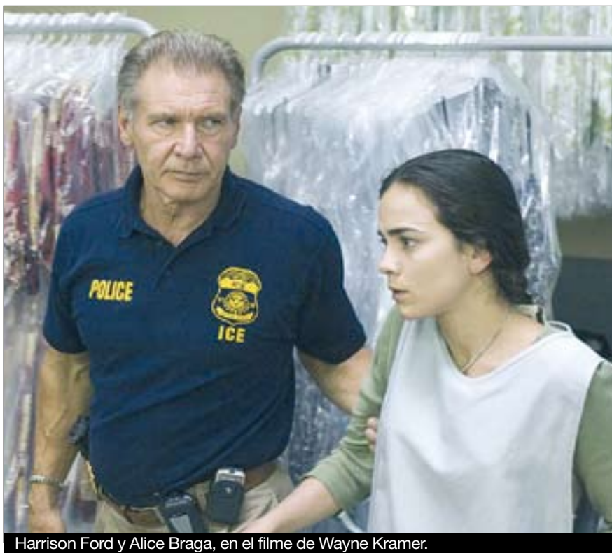
Harrison Ford y Alice Braga, en el filme de Wayne Kramer.

Por ello, poco podemos esperar de este Territorio prohibido , un drama sobre la inmigración y los esfuerzos de los habitantes ilegales, de multitud de países y razas de todo el planeta, por conseguir el estatus de residente legal en un Los Ángeles