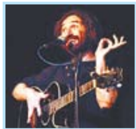
NÁUTICO Daniel Higiénico SAN VICENTE DO GROVE CANTAUTOR

✓ La Sala Mondo de Vigo acoge esta noche el concierto de Delafé y las flores azules. Las canciones de esta exitosa banda se mueven entre el hip-hop y el pop, ya que combinan el parafraseado del hip-hop con melodías y estructuras más propias del pop, el soul o la música electrónica. Delafé y las flores azules, que ya ha pisado Galicia en numerosos conciertos y festivales, cuenta con unas bases muy bien tratadas junto a unas letras que recuperan la tradición del costumbrismo social de los cantautores.