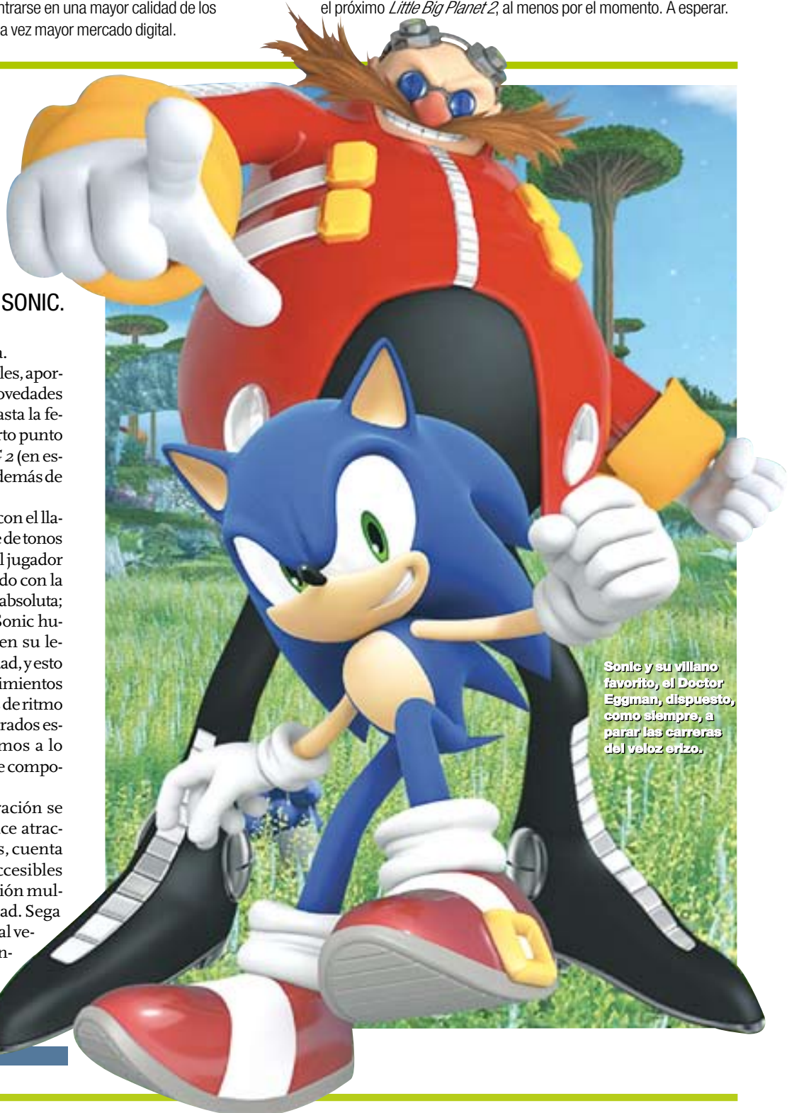
Sonic y su villano favorito, el Doctor Eggman, dispuesto, como siempre, a parar las carreras del veloz erizo.

Los Sims 3 / Las personas virtuales más famosas llegan a las consolas