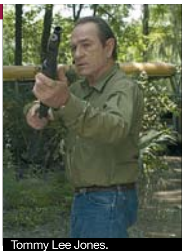
Tommy Lee Jones.

Un detective privado (Tommy Lee Jones) que se encuentra en los estados sureños persiguiendo a un asesino en serie de chicas jóvenes tiene una secuencia de surrealistas e imposibles encuentros con una tropa de soldados del bando confederado durante la guerra civil norteamericana.