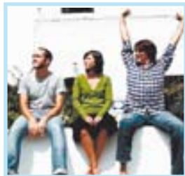
SALA MONDO Delafé y las flores azules VIGO HIP-HOP, POP

✓ Nacidos en Albacete en marzo de 2000, Angelus Apatrida se convirtieron en uno de los máximos exponentes de la escena Thrash Metal española. En enero de 2003 la banda decidió dar un golpe radical y cambiar completamente su actitud, imagen y música, acercándola a un heavy metal mucho más duro y que imita al movimiento thrasher que nació en la Bay Area de San Francisco en los años 80. La Iguana Club acoge esta noche el directo de la banda a las doce de la noche. Las entradas cuestan 15 euros.