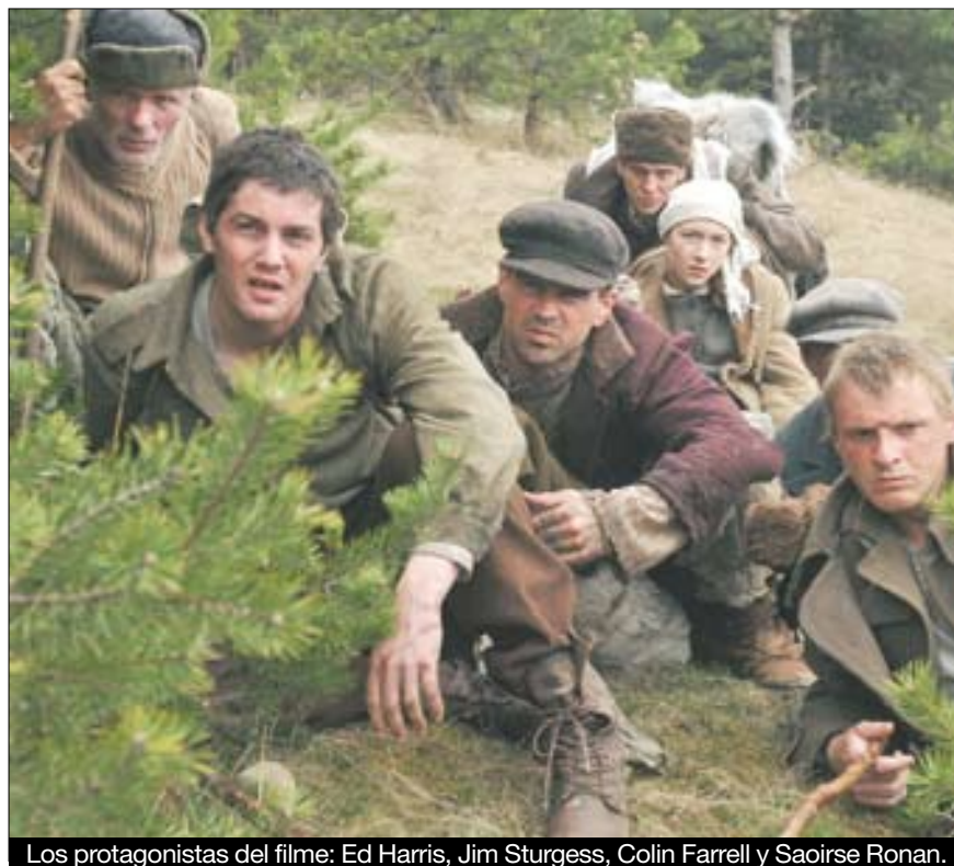
Los protagonistas del filme: Ed Harris, Jim Sturgess, Colin Farrell y Saoirse Ronan.

Tras una actividad frenética que le llevaría a rodar 18 de sus 28 producciones en poco más de 10 años, el ritmo de productividad de Peter Weir disminuiría notablemente en el momento en el que el realizador australiano saltaba a la palestra internacional con su interesantísima Gallipoli . Corría el año 1981 y, desde entonces, el cineasta sólo ha sido capaz de rodar nueve filmes más, ¡pero qué nueve! En los 30 años que han pasado desde aquella cinta con un novato Mel Gibson, Weir nos ha dejado para la posteridad títulos como El año que vivimos peligrosamente (de nuevo con Gibson), la magnífica Único testigo o La costa de los mosquitos (ambas con un excelente Harrison Ford), la mítica El club de los poetas muertos , la sencilla Matrimonio de conveniencia , Sin miedo a la vida (quizás su filme más olvidable), la magistral El show de Truman (sin duda alguna, la mejor interpretación de Jim Carrey) y la no menos magistral Master and commander .