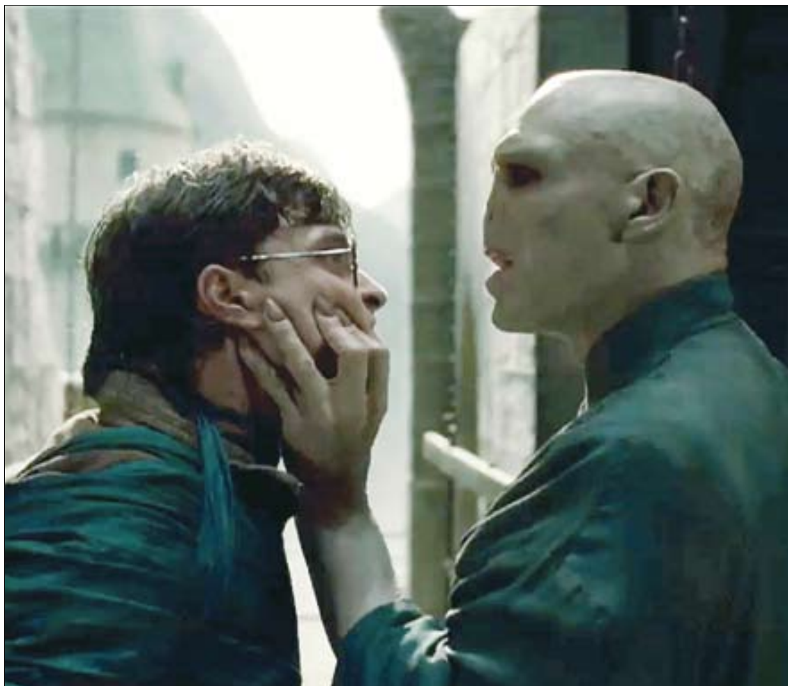
El desenlace de 'Harry Potter', la nueva de 'Piratas del Caribe' o 'Cars 2' llegarán este nuevo año.

Un cine mayoritario al que también se apunta, aunque con un grado superior de calidad, Steven Spielberg. Tras el último Indiana Jones , presentado en 2008, Spiel-