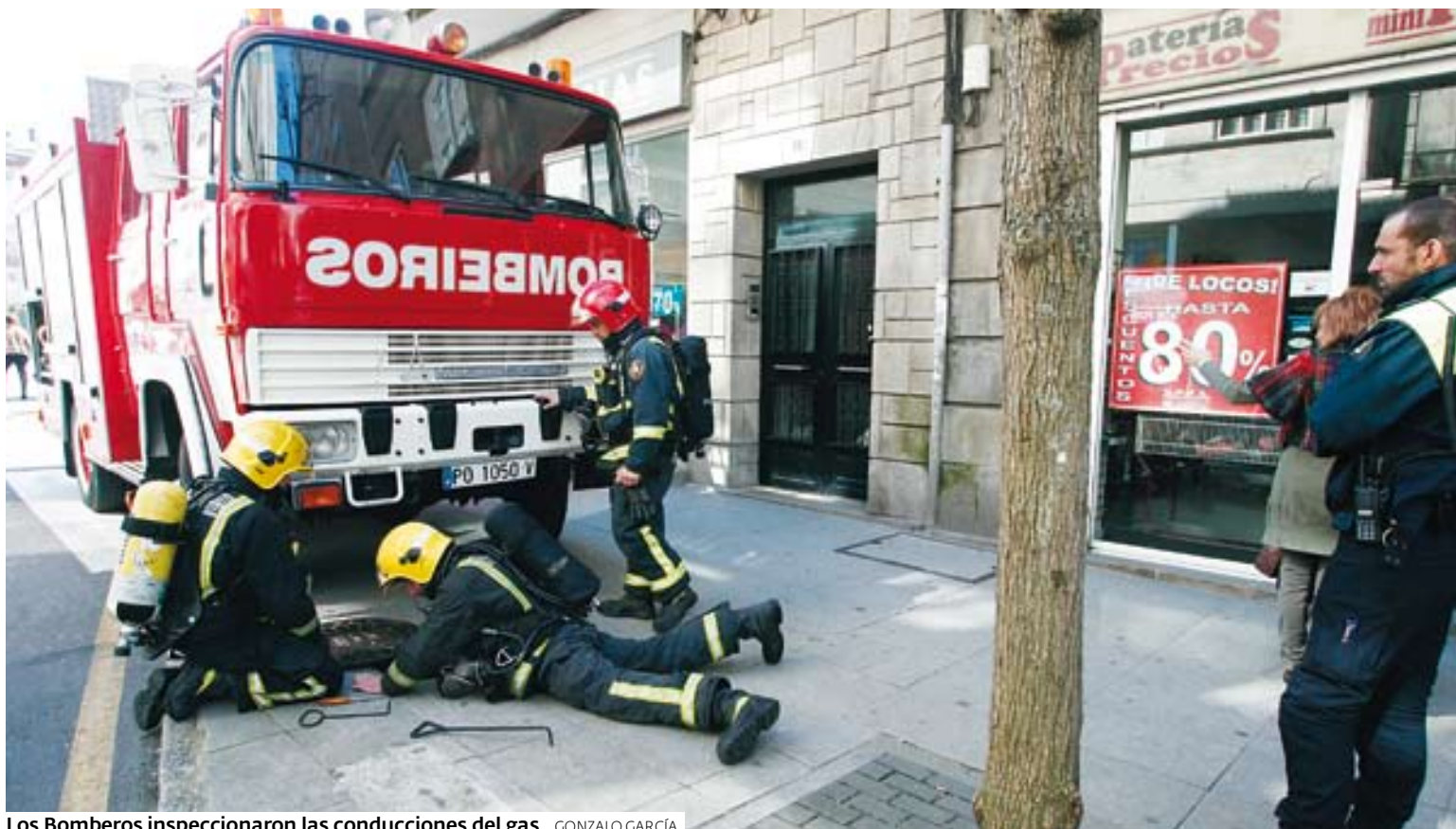
Los Bomberos inspeccionaron las conducciones del gas.

ÍNDICE | 2 PONTEVEDRA CIUDAD | 14 POIO | 17 MARÍN | BUEU | CANGAS | SANXENXO | O SALNÉS | CALDAS | O DEZA | 51 ESQUELAS | 81 JUEGOS | 79 CARTELERIA | 81 EL TIEMPO | 80 TRANSPORTES | 82 TELEVISIÓN