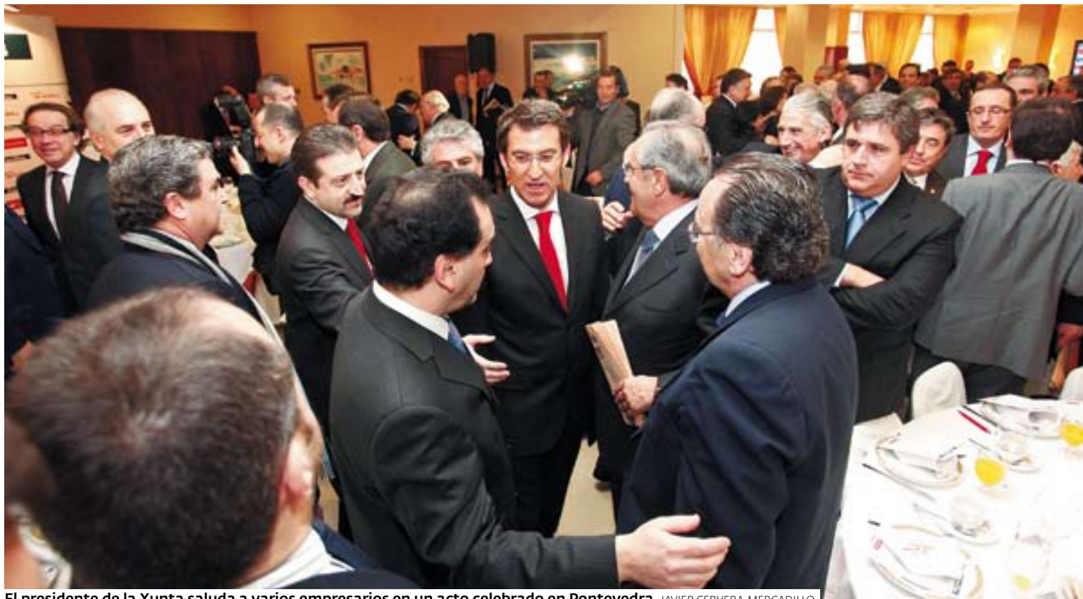
El presidente de la Xunta saluda a varios empresarios en un acto celebrado en Pontevedra.

ÍNDICE | 2 PONTEVEDRA CIUDAD | 12 POIO | 14 MARÍN | BUEU | MARIN | CANGAS | SANXENXO | O SALNÉS | CALDAS | O DEZA | 65 ESQUELAS | 81 JUEGOS | 79 CARTELERIA | 81 EL TIEMPO | 80 TRANSPORTES | 82 TELEVISIÓN